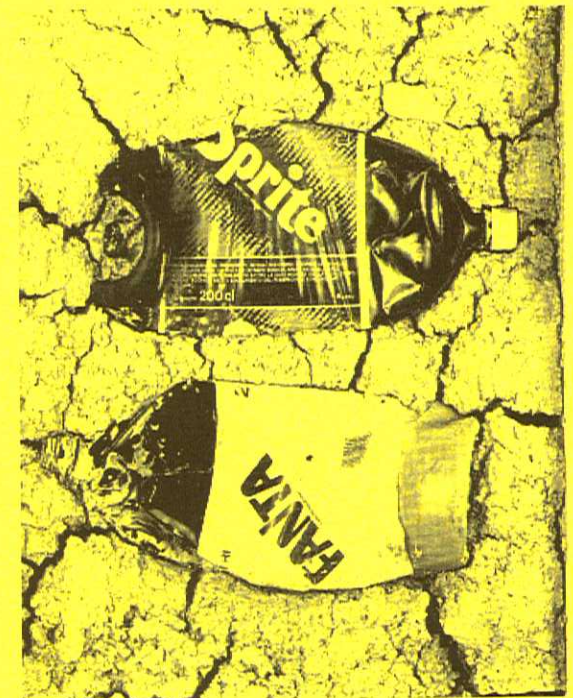
Bernd Löbach-Hinweiser: „Klassiker der Umweltverschmutzung“ 1988

Im Gegensatz zu Sammlungen historischer Gebrauchsgegenstände in Museen sind die Gegenstände im „Museum für Wegwerfkultur“ solche, die uns direkt ansprechen, weil wir sie heute im Alltag auch benutzen. So können wir durch ihre Betrachtung auch Rückschlüsse auf unser eigenes Verhalten ziehen und dies, wenn notwendig, korrigieren.