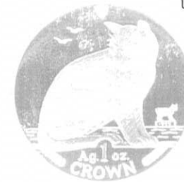
Silbermünze: 1 Crown, Isle of Man (1990)

Diese Ausstellung beschäftigt sich daher neben den erwähnten Themen auch mit der richtigen Pflege und Ernährung der Katze. Ein musikalisches und literarisches Begleitprogramm ergänzt, was Mensch und Katze zum Glückseligkeit benötigen.