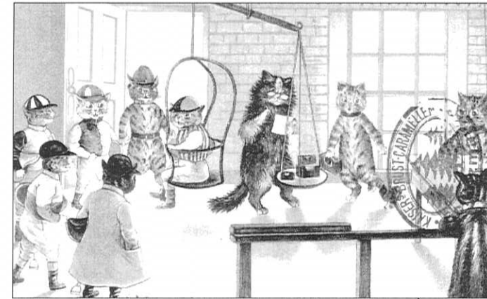
Katzen in der Werbung um 1900

Nicht unerwähnt soll bleiben, daß die Hauskatze in der heutigen Zeit sehr vielen Menschen Freude, Kraft und Zärtlichkeit schenkt.