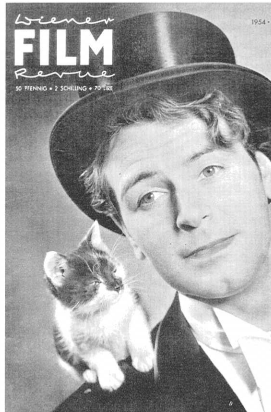
Ankündigung zum Film: „Solang, du da bist“ mit O. W. Fischer, 1954

Doch die Katze gilt auch als schicksalhaftes Tier und war oft mit Aberglauben und Magie untrennbar verbunden. Noch heute kommt die Katze im chinesischen Horoskop und in der magischen chinesischen Zeitrechnung vor.