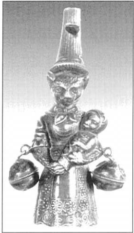
Kinderrassel (um 1840)

Der Anbeginn des Zusammenlebens von Katze und Mensch liegt im Dunkeln. Sicher ist, daß die Katze als Hausgenosse des Menschen in Ägypten eine sehr bedeutende Rolle gespielt hat: Sie wurde seit etwa 3000 v. Chr. als heiliges Tier und vorübergehend, in einigen Regionen, als Luxustier verehrt und gehalten. Die Göttin Bast wurde mit dem Körper einer Frau und dem Kopf einer Katze dargestellt.