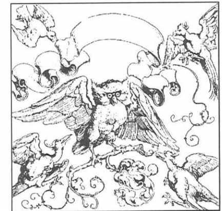
Die Eule als Sinnbild des zu Unrecht Verfolgten Albrecht Dürer (?), um 1515

In der Vorstellung der alten Griechen und Römer nehmen Zauberer und Hexen Eulengestalt an. Man nagelte daher Eulen zum Schutz gegen Blitz und Dämonen an Haus und Scheunentore. Eier, Federn und Fleisch der Eule dienten dem Liebeszauber und für Verhexungen. Herz und Fuß wurden als Amulette getragen.