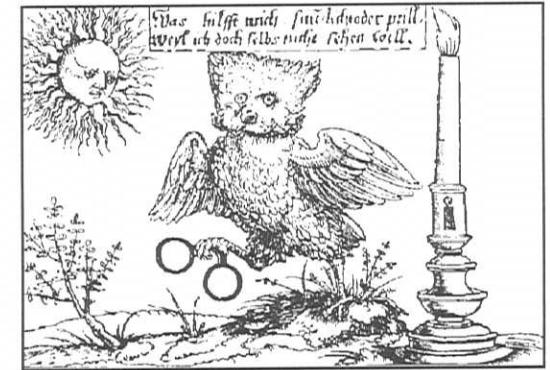
Die lichtseheue Eule als Zeichen der Sünder

In der Bibel zählt sie zu den unreinen Tieren (3;Mos.11, 16-17).