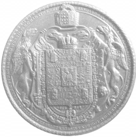
Der „gute Kaiser Franz“ besitzt in den Jahren 1804 - 1806 die doppelte Kaiserwürde, demgemäß zeigt er in seinem Majestätssiegel einen doppelten Doppeladler.

Auch der jüngeren Generation sind die vielen Doppeladler wohlbekannt, die uns das Haus Habsburg in Österreich und in den Ländern der alten Donaumonarchie hinterlassen hat. Das die Ehre und die Herrschaft der „Casa d'Austria“ rühmende Zeichen wurde unter Karl V. in die ganze Welt getragen.