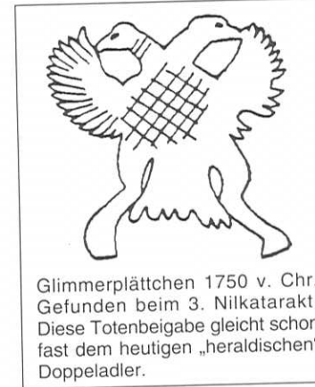
Glimmerplättchen 1750 v. Chr. Gefunden beim 3. Nilkatarakt. Diese Totenbeigabe gleicht schon fast dem heutigen „heraldischen“ Doppeladler.

Das Hauptanliegen dieser Ausstellung ist es, den Besuchern die bisher vorliegenden etwa mehr als zwanzig Deutungen für den Ursprung des Doppeladlers vorzulegen.