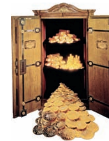
Tresor mit Goldmünzen

Gold ist seit jeher ein faszinierendes Edelmetall, ob als Zahlungsmittel, Münze oder Schmuckstück. Gold ist unvergänglich und zuverlässig – heute mehr denn je. Gerade in Krisenzeiten ist die Nachfrage nach etwas Wertbeständigem besonders groß, darum greifen immer mehr Menschen auf Gold als Wertanlage zurück.