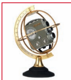
100.000-ste C3 Kamera

Die Firma Eumig entwickelte und produzierte unter Einsatz maßgebender Innovationen einfache und preiswerte Produkte. So wurde 1935 mit der Eumig C2 die erste Filmkamera der Welt mit halb-automatischer Belichtungsregelung auf den Markt gebracht und 1937 mit der Eumig C4 die erste Kamera der Welt mit elektromotorischem Antrieb produziert.