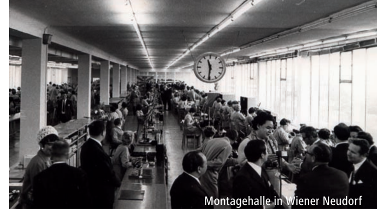
Montagehalle in Wiener Neudorf

1954 wurde der erste Filmprojektor der Welt mit Niedervoltbeleuchtungssystem entwickelt. Mit dem Eumig TV 310 entstand 1958 der erste Fernseher der Welt in Modulbauweise. 1975 leitete der Bildschirmfilmprojektor Eumig R2000 die Tageslichtprojektion ein. Eumig Metropolitan HiFi – Kassettengeräte brachten 1977 Studioqualität erstmals auch für Kassettengeräte.